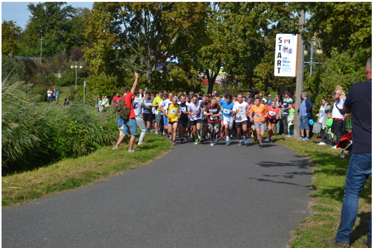
Start do mini BL – 4,2km