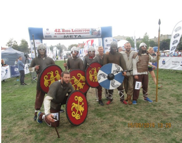
Wojowie po pokonaniu trasy XLII BL