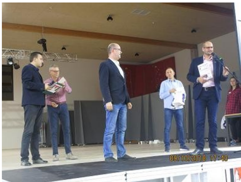
Organizatorzy XLI Biegu Lechitów