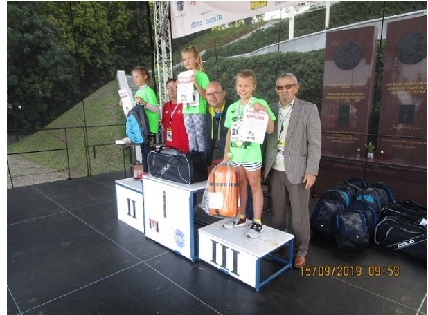
Nagradzani w biegach młodzieżowych XLII BL