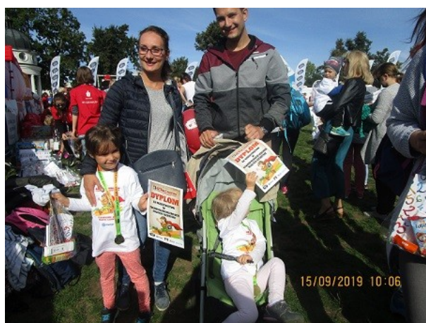
Młodzi Lechici – po Igrzyskach 42 BL