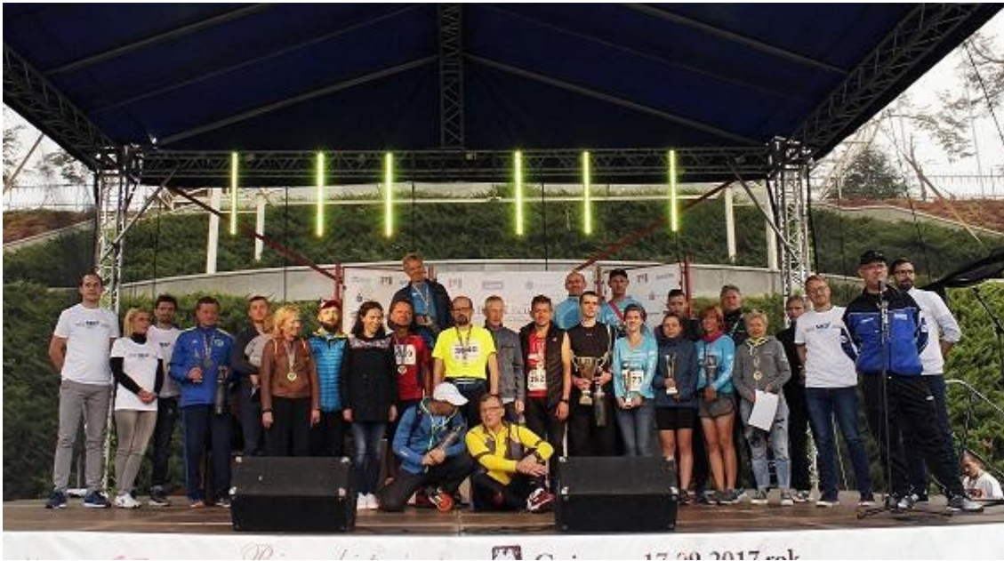
Lekarze po pokonaniu XL BL i odbiorze nagród