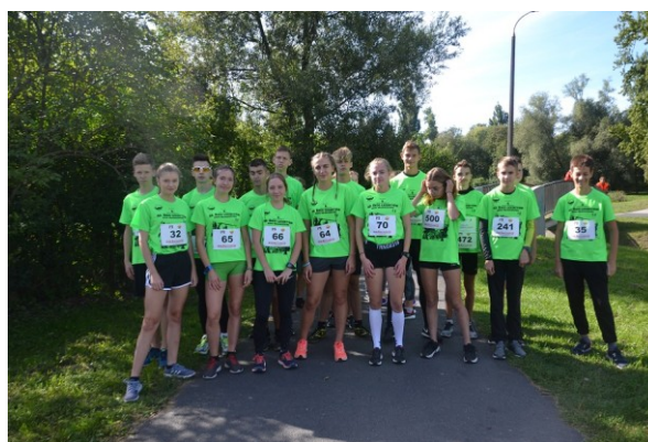
Start do biegów młodzieżowych XLII BL