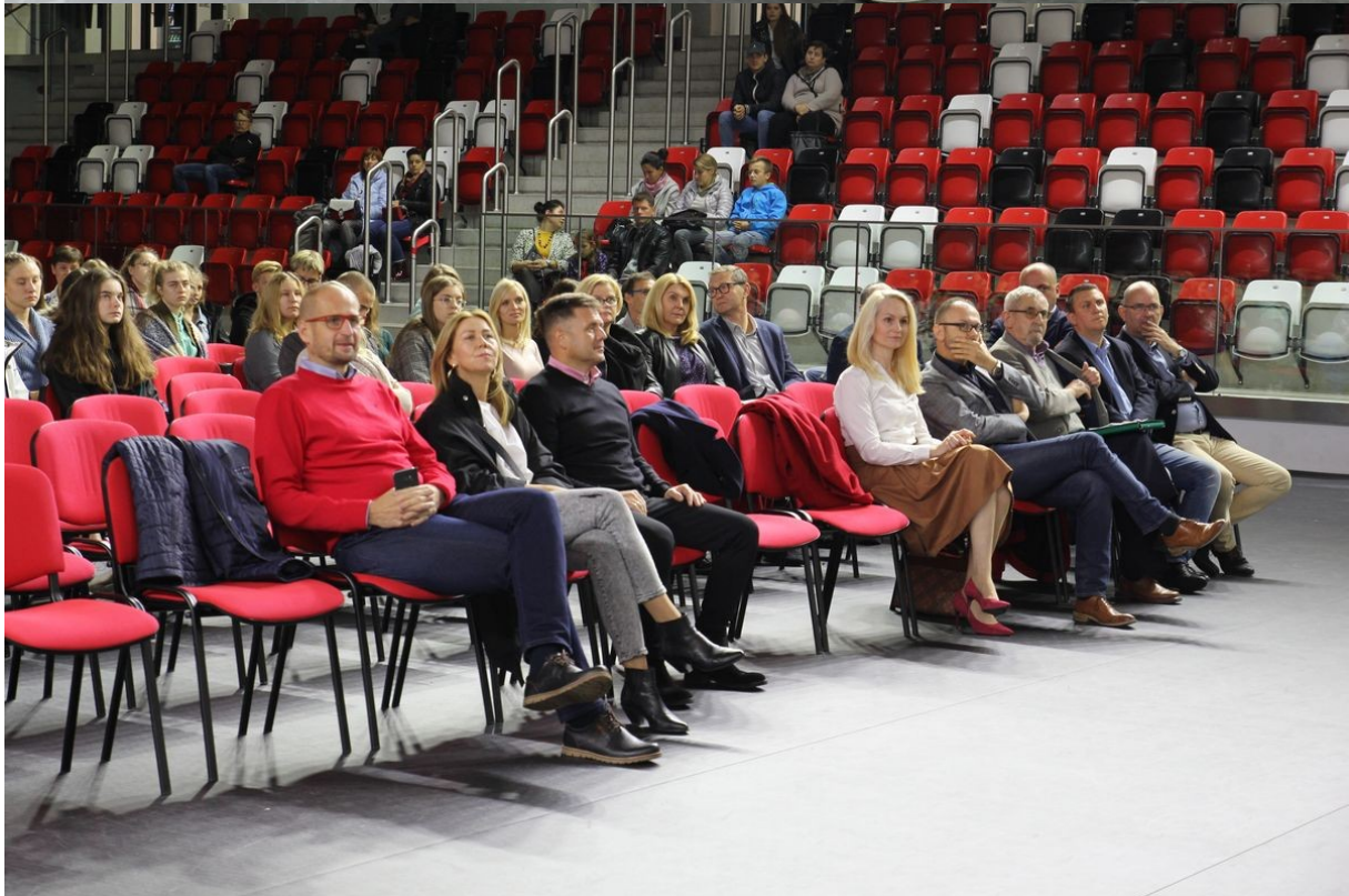
Sponsorzy i wolontariusze na podsumowaniu XLII BL