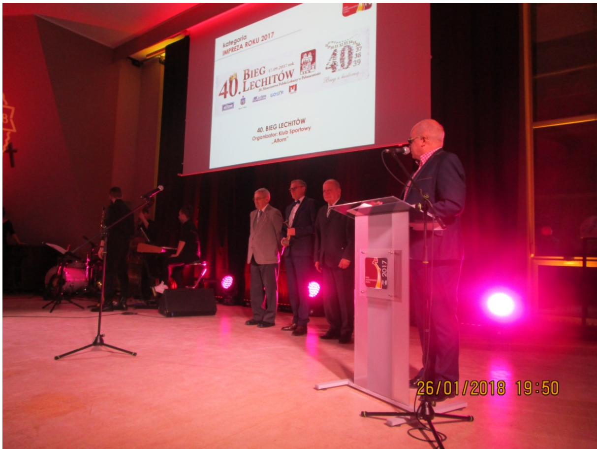
26 stycznia 2018 r. podczas XIII GALI ORŁY GNIEŹNIAŃSKIEGO SPORTU prowadzący