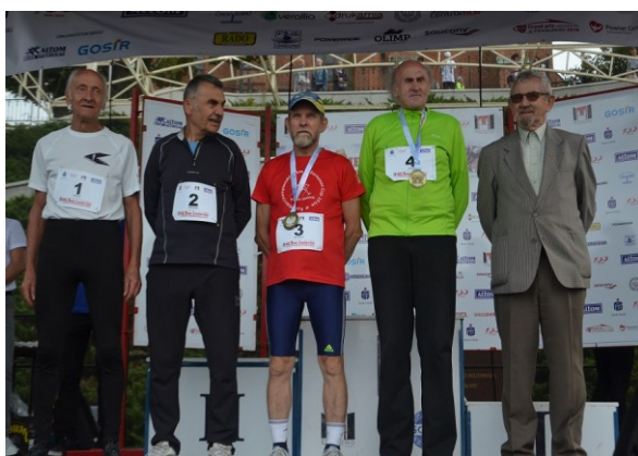
Wierni Lechici przed i po XLII Biegu Lechitów