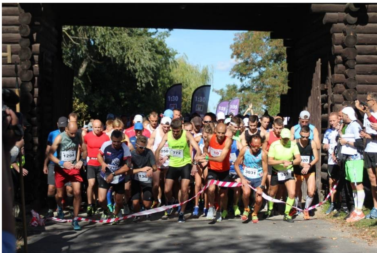
Start do rekordowego 41 Biegu Lechitów

Podobnie jak poprzednie biegi także XLI (41) został zorganizowany i przeprowadzony wzorowo, w którym pobito wiele rekordów (uczestników , kobiet, lekarzy).