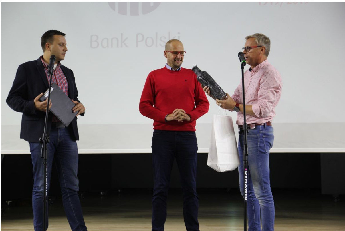
Dyrektor XLII BL wręcza puchar prezydentowi m. Gniezna