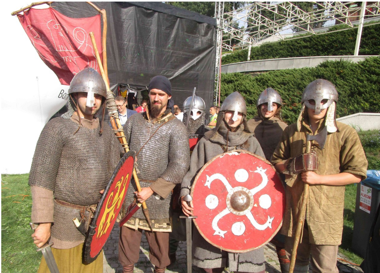
Wojowie po pokonaniu trasy BL