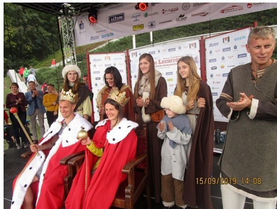
Zwycięzcy XLII BL koronowani